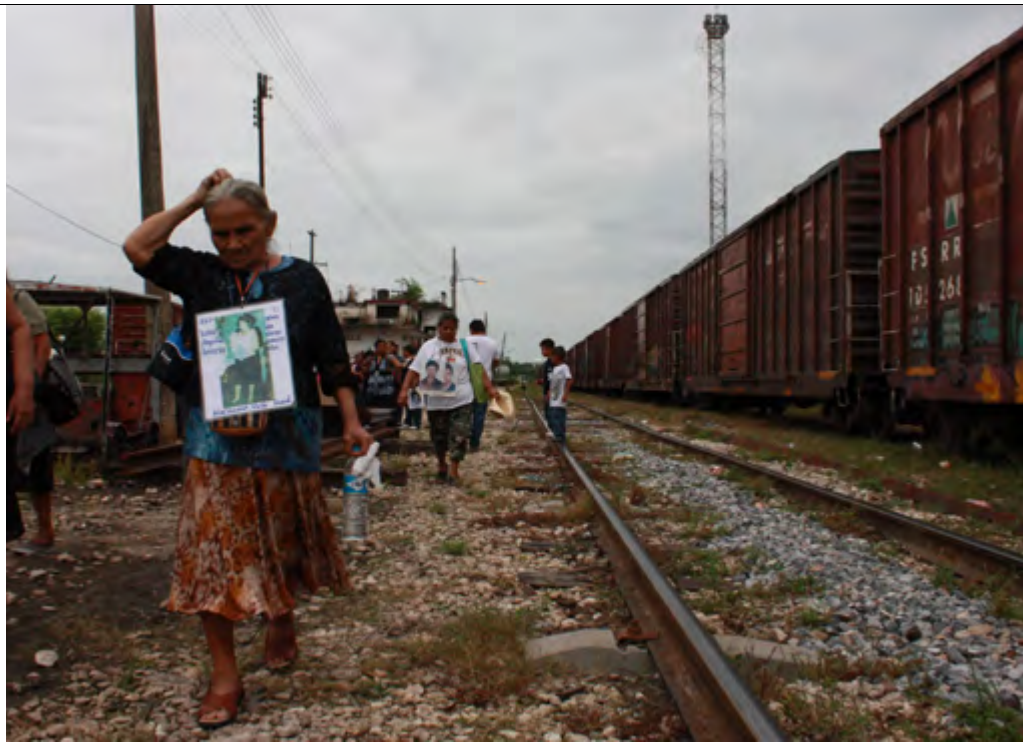
Madres buscan a sus hijos desaparecidos, Tenosique, Tabasco

d) Un ombudsman del pueblo: ¿Cuántas veces se le vio al Sr. Raúl Plascencia Villanueva caminado con el pueblo? Nunca, sólo se le vio del lado del poder y de los poderosos. Es urgente un Obudsman que se quite el traje y