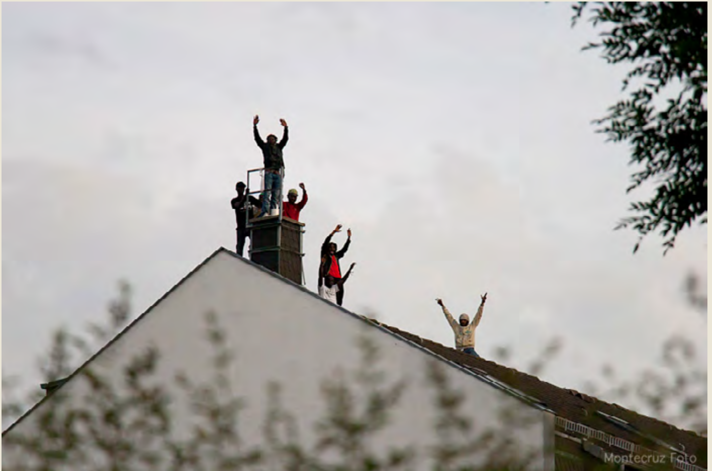
Refugiados en Alemania.