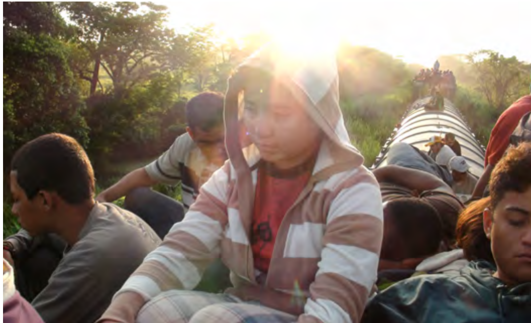
Migrantes sobre el tren en algún lugar entre Tenosique, Tabasco, y Coatzacoalcos, Veracruz.